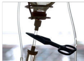
Abgeklippt: Die Einnahmen der Unikliniken decken nicht mehr die Ausgaben.

M agdeburg | Fieberhaft sucht die Politik nach einem Heilmittel für die Unikliniken Halle und Magdeburg, die Millionen-Defizite produzieren. Einige Fehlentwicklungen sind bundesweit zu beobachten - drei sind eine Besonderheit von Sachsen-Anhalt.